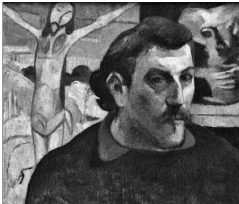
PAUL GAUGUIN, AUTORITRATTO CON CRISTO GIALLO (1889). IMPRESSIONA L'ESPERIENZA DEL FALLIMENTO CONDIVISA TRA GAUGUIN E IL CRISTO, ASSIMILATI DAI TRATTI SOMATICI E DALLA STESSA SOFFERENZA. NEL GIALLO DEL CRISTO PRENDE FORMA E COLORE TUTTA LA PEDAGOGIA DEL CHICCO DI GRANO CHE SOLO SE MARCISCE PORTA SPIGHE E PANE.

Ma questo accade anche nella nostra vita "pelagiana": ci alleiamo facilmente con la nostra astuzia, il nostro coraggio e la nostra forza facendone i cavalli di battaglia e basta un niente per farli diventare fragili talloni d'Achille; e magari rifiutiamo facilmente, seppellendoli e zittendoli, le nostre paure, i nostri difetti, i nostri fallimenti e ferite. È invece potente frequentare questi ultimi con preghiera, cioè con lo Spirito Santo, e scoprirne cosa ci fanno nella mia storia, quali sorprese mi possono regalare, cosa è