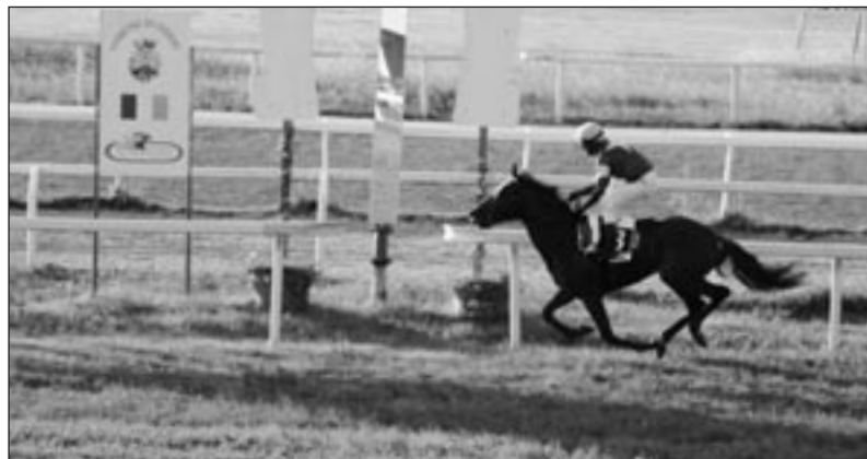
L'ARRIVO DI ITTE BELLU NEL PR. MESU E RIOS SRL

L'acqua ha invaso quartieri, bloccato la viabilità, provocato danni ingenti e costretto numerose famiglie a chiedere aiuto. Di fronte a un fenomeno così improvviso, la comunità ha reagito con compattezza, mentre l'Amministrazione comunale si è attivata immediatamente per gestire l'emergenza.