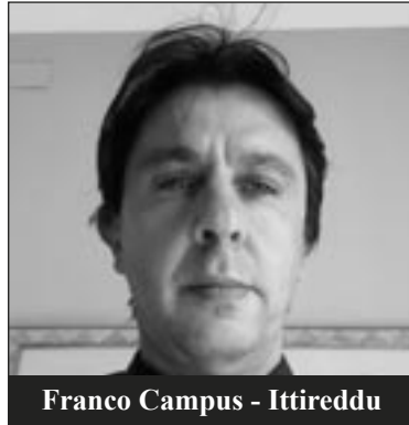
Franco Campus - Ittireddu