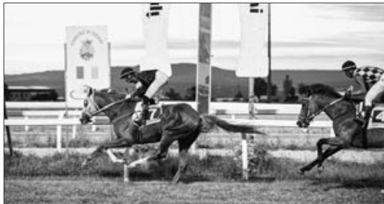
IV CORSA: HEDONISM CONDUCE DAVANTI A NEVER ENDING STORY.