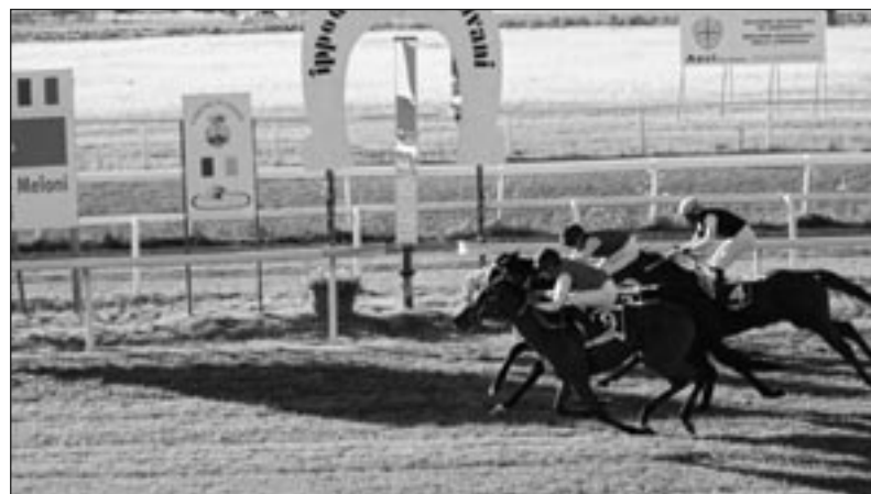
NUOVAMAN VINCE IL PR. S. GIULIANO DI UN MUSO