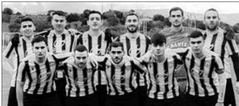
LA SQUADRA DEL BERCHIDDA